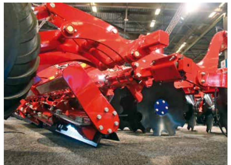
Sur le stand Horsch, de multiples solutions agronomiques dont son déchaumeur à disques précédé d'un rolofaca.