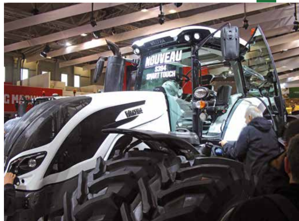
Le Valtra Smart Touch pris d'assaut par les visiteurs, pour voir l'accoudoir multifonctions intuitif.