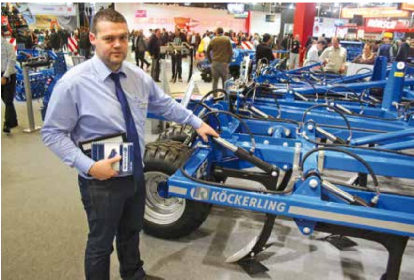
Chez Köckerling, le mulcheur déchaumeur dispose d'un effacement hydraulique des dents en cas de bourrage de pailles.