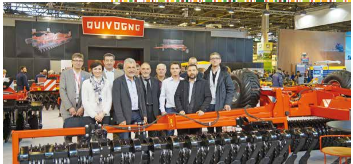
Sur le stand Quivogne, l'équipe Agrimat et le groupement Delta Force en réunion avec l'ensemble de ses adhérents. Delta Force regroupe des distributeurs de matériels agricoles qui achètent en gros pour revendre aux meilleurs prix.