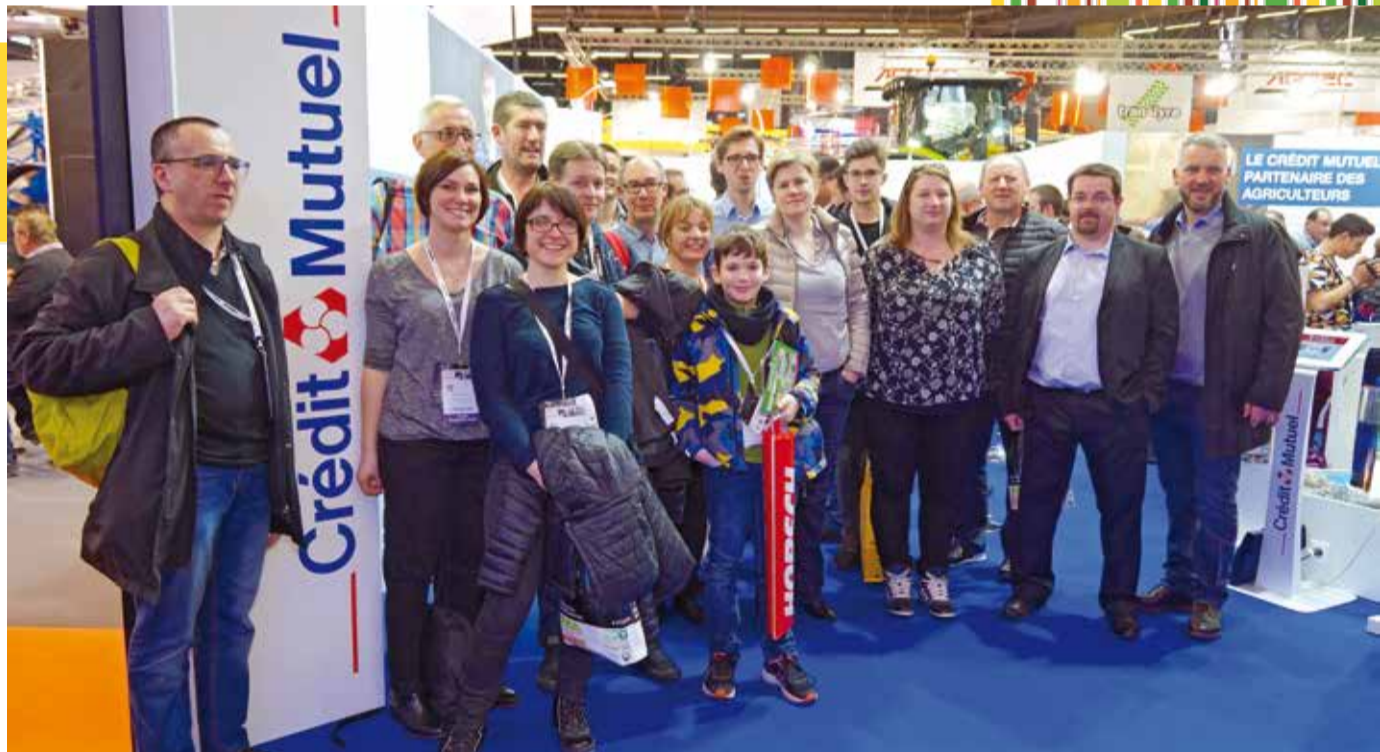
480 agriculteurs se sont levés aux aurores, le mardi 28 février, pour prendre la rame spécialement affrétée par la Direction régionale Nord du Crédit Mutuel. Pour 75 € seulement, ces clients et prospects bénéficiaient de l'aller-retour en train dans la journée, ainsi que de l'entrée au Sima. Certains en ont profité pour faire un petit tour au SIA.