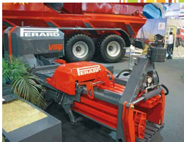
Chez Pérard, le prototype de presse à menue paille VMP s'attèle à la moissonneuse.