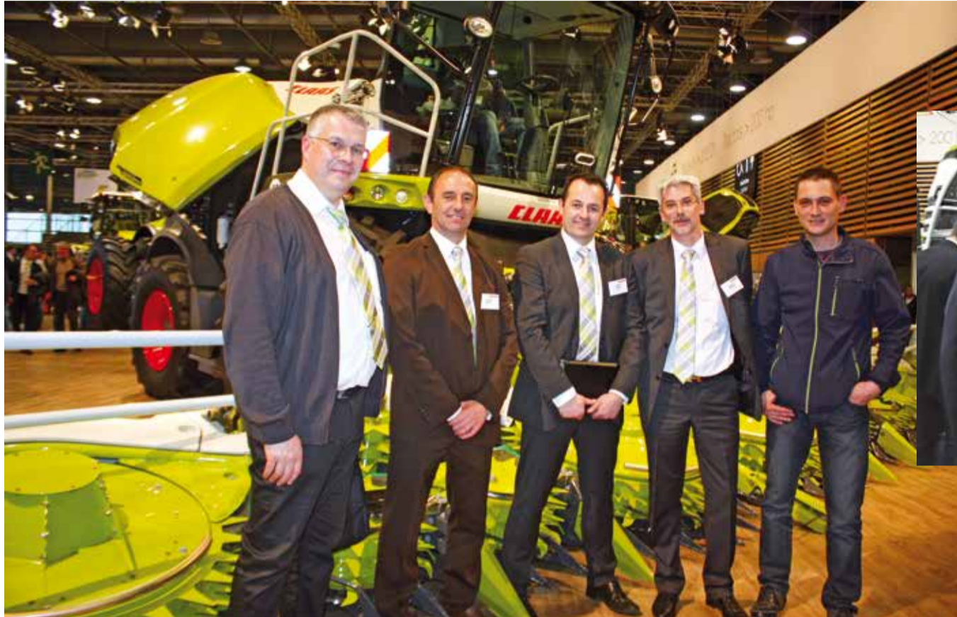
La concession JF AGRI et l'équipe Claas posent devant la nouvelle Jaguar type 498. Pas de grande nouveauté pour ce Sima, mais la marque promet une belle surprise pour Agritechnica qui se déroulera à Hanovre du 12 au 18 novembre 2017. Cette année le stand s'articule autour de la thématique «Être agriculteur dans 10 ans», avec les évolutions dans le numérique et les nouvelles technologies.

Salon international du machinisme agricole créé en 1922, le Sima offre une vitrine à quelque 1770 entreprises en provenance d'une quarantaine de pays. Sur la plupart des stands, les représentants de nationalités diverses se côtoient, échangent, sur les demandes spécifiques de leurs clientèles locales. Certains de vos concessionnaires alsaciens avaient fait le déplacement pour s'enquérir des nouveautés qu'ils pourront bientôt commercialiser, d'autres s'étaient apprêtés aux couleurs de leurs marques pour promouvoir eux-mêmes leurs produits auprès des visiteurs et parfois de leurs clients.