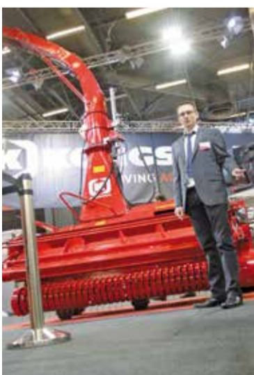
Chez Kongskilde, l'ensilage des fauches avec le FCT king size, un pick up de 3,10 m, détecteur de métal, bec à maïs en option.

Presse à menue paille, tracteurs électriques ou sans cabine, ni chauffeur, pneus intelligents, cette édition 2017 du Sima n'a pas manqué de nouveautés. Avec toujours les gros tracteurs pris d'assaut par les visiteurs.