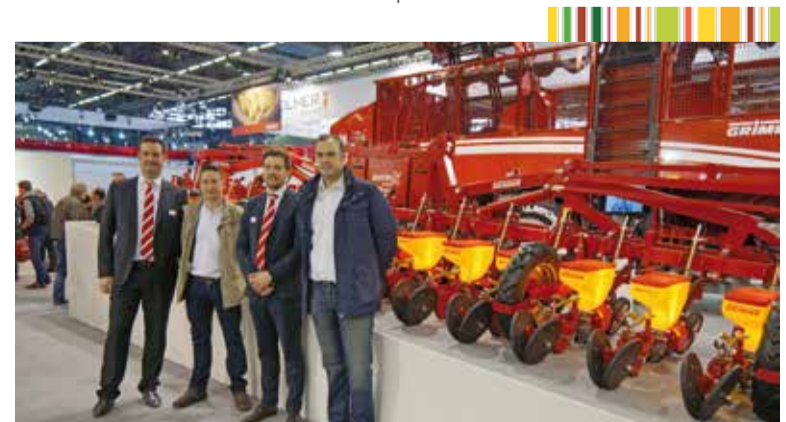
Des membres d'Euro Agrar en compagnie de représentants Grimme devant le nouveau semoir 18 rangs Matrix 1800 (existe aussi en 12 rangs). Ses particularités : l'entraînement est électrique et le point de chute est le plus bas du marché. L'écartement est de 45 ou 50 cm. L'outil fonctionne en Isobus.