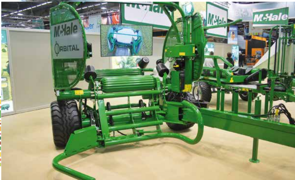
Chez Mac Hale, l'unité mobile d'enrubannage en continu orbital la plus rapide et productive du marché.