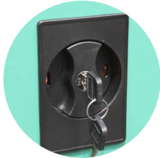
> Porte avec fermeture à clé