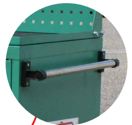
> Poignée pour faciliter le déplacement