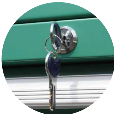
> Fermeture centralisée des tiroirs par clé