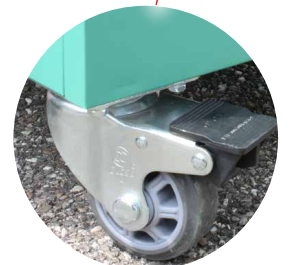
> Roues amovibles avec freins

BEISER Environnement • Domaine de la Reidt 67330 BOUXWILLER • Fax : 0 825 720 001