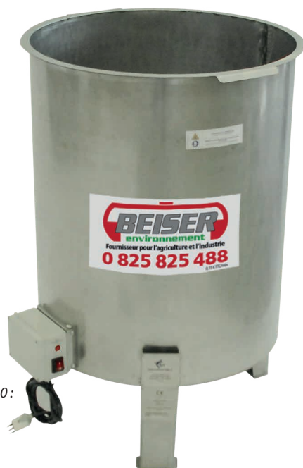
Modèle DIT LT140 :