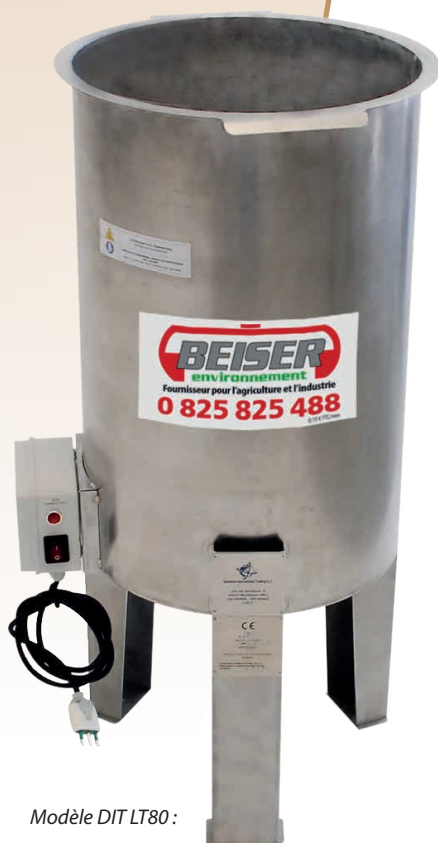
Modèle DIT LT80 :