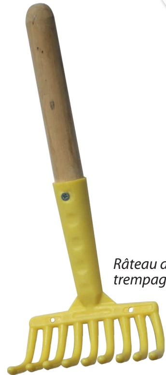
Râteau de trempage