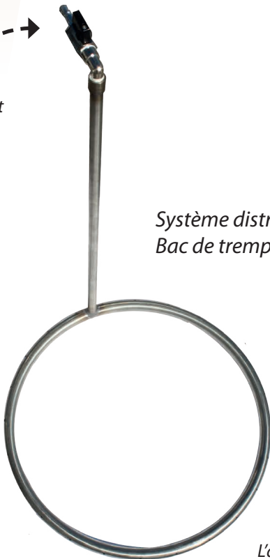
Système distribution Air pour Bac de trempage