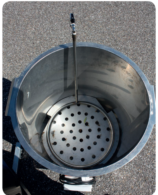
L'addition d'air lors du trempage permet un meilleur décollement des plumes