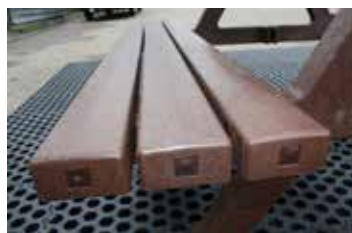
• Lames assises Premium (x6)