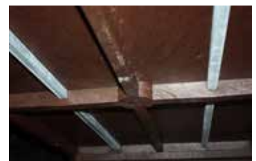
• Armature métallique pour le maintien du plateau table monobloc