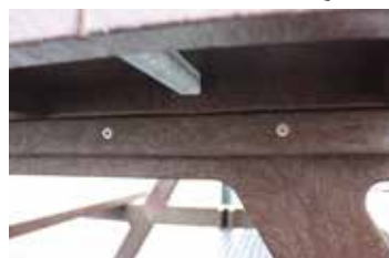
• Visserie complète en inox fournie