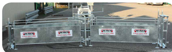
Panneau tôle 1,50 m x 0,90 m ou 2 m x 0,90 m