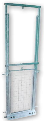
Porte guillotine (grillagé) 700 x 175 x 1970 mm

Photos non contractuelles. Les caractéristiques, les dimensions et les poids indiqués sur cette fiche n'ont qu'une valeur indicative.