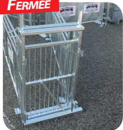
Porte coulissante latérale 670 x 250 x 1000 mm