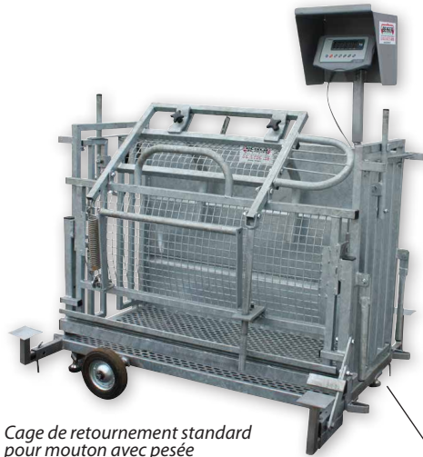
Cage de retournement standard pour mouton avec pesée