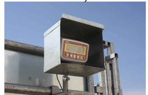
Indicateur de pesée

BEISER Environnement • Domaine de la Reidt 67330 BOUXWILLER • Fax : 0 825 720 001