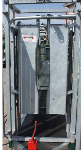
Porte guillotine avec corbeille de retenue