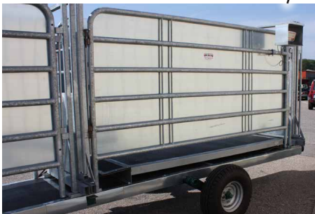
Plateforme de pesée