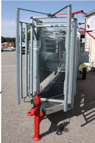
Porte avant ouverte