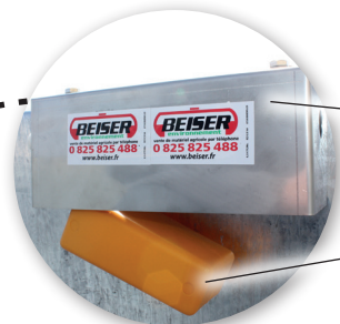
Protection du flotteur en inox