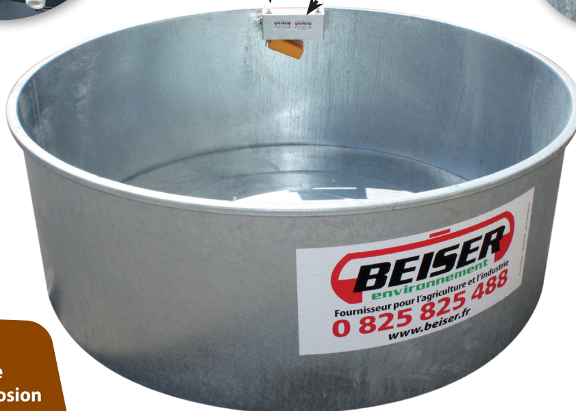
Flotteur en PVC