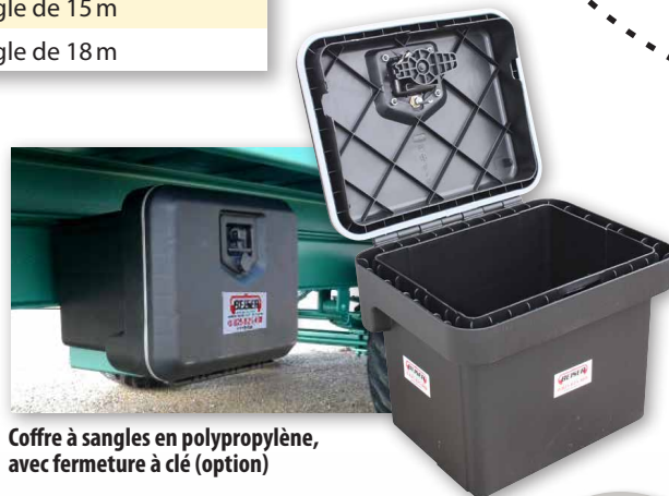
Coffre à sangles en polypropylène, avec fermeture à clé (option)

Treuil manuel et crochet pour deuxième remorque