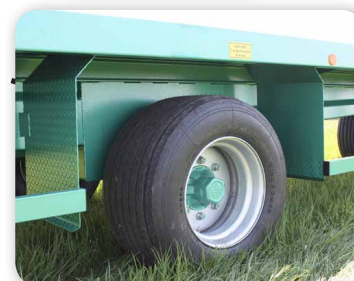
Roues en 435/50 R19,5

BEISER Environnement • Domaine de la Reidt 67330 BOUXWILLER • Fax : 0 825 720 001