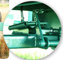
Système de freins