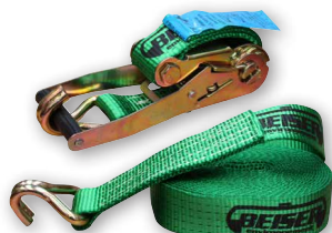
Sangle à cliquet Beiser (option)