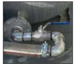
Vanne d'alimentation pompe/citerne