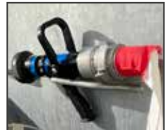
Lance incendie à sélection de débit