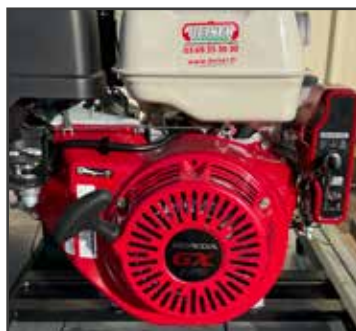
Moteur thermique 4 temps à démarrage électrique avec refroidissement par air