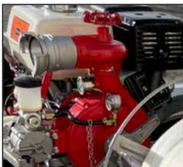
Pompe spéciale incendie