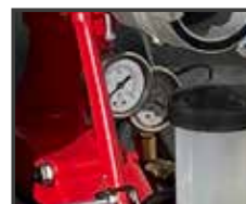
Manomètre de pression