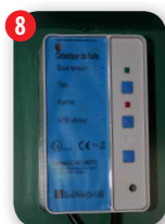
Détecteur de fuite