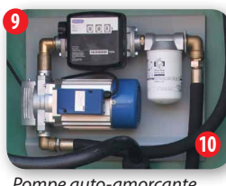
Pompe auto-amorçante avec une garantie totale de 3 ans