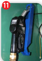
Pistolet avec arrêt automatique