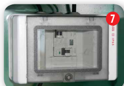
Disjoncteur avec différentiel 220 V