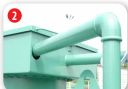
Trou d'homme sécurisé

Armoire de distribution 2 portes cadenassable comprenant 3 enrouleurs de 8 m pour la distribution de gasoil, d'air et de graisse, un compresseur à air avec contenance de 50 litres avec débit d'air de 27 m 3 /heure et une pression maxi d'utilisation de 11 bars, un ensemble mobile graisse avec un rapport de 50/1 et un débit de 1,1 kg par minute, une pompe auto-amorçante avec garantie 3 ans, une prise de courant 16 A, un kit PRO avec 4 accessoires et un éclairage total de l'armoire.