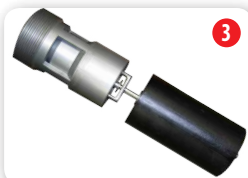
Limiteur de remplissage